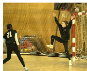
Couvrir de l'espace de but