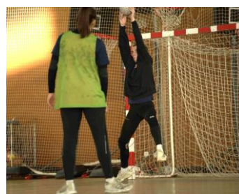
Se grandir pour attraper la balle