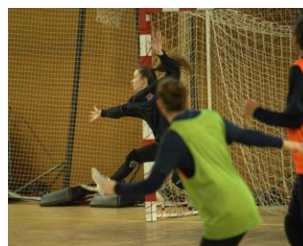
Poussée de jambe en extension vers la balle, bras opposé en équilibre et couverture, regard sur la balle