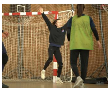
Dissociation-poussée pour couper la trajectoire du ballon