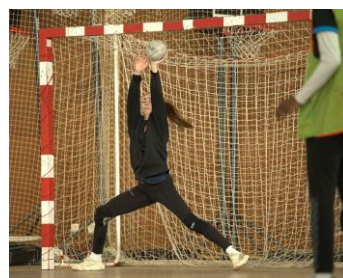
Dissociation jambes-bras, placement du corps dans la trajectoire du ballon