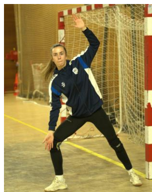
Parade sur tir bas ou mi-hauteur au 2 ème poteau