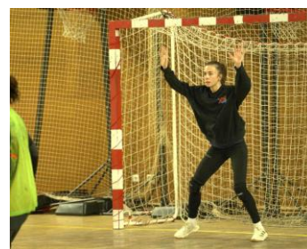
Mise en tension