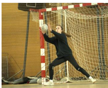
Amortir la balle sur le tir

Chercher à enchaîner les tâches pour RELANCER/TIRER