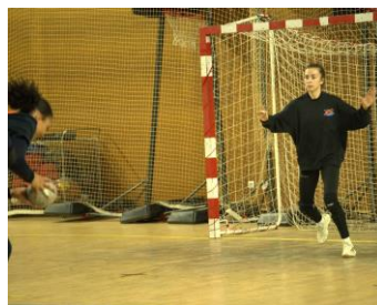
Courir se placer et couvrir un secteur de tir