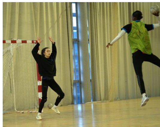
Offrir le moins de solutions de tirs possible