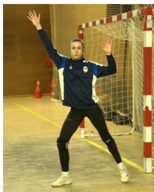
Parade sur tir en lucarne 2 ème poteau