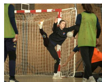
Parade en fermeture bras-jambe