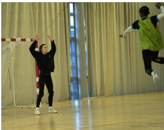
S'avancer en couverture pour être prêt au duel