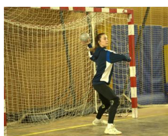
Dynamisme et sobriété