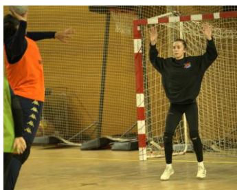
Finir de bien lire