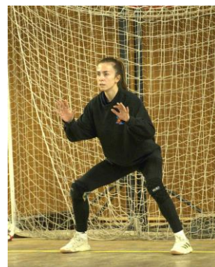
« Le Chat »