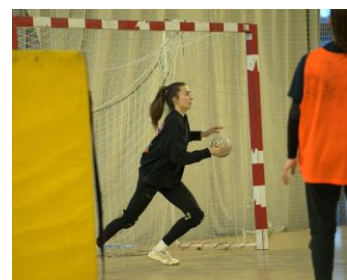
Avoir l'intention d'aller vite