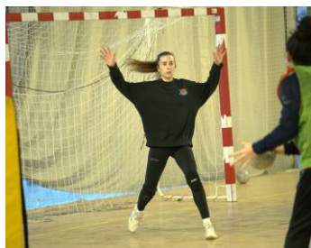
S'avancer et être prête à temps

Placement, posture et exemples d'actions face à UN TIR DE PIVOT ou SUR UNE COURSE DE TRAVERSEÉ DE LA DÉFENSE