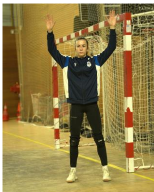
Pré-parade avancée en couverture d'espace