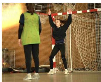
Réduire les possibilités de tir