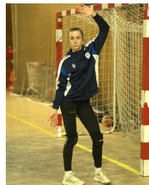
Parade "hanche" 2 ème poteau