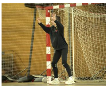
Posture équilibrée en lecture du jeu et recherche d'informations

Placement, posture et exemples d'actions face à UN TIR DE LOIN