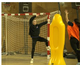
Alignement vertical du corps et bataille pour l'espace haut