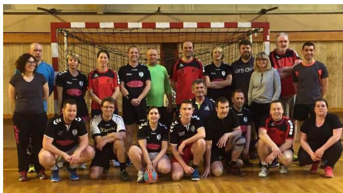
Rencontre Loisir à GRAVENCHON