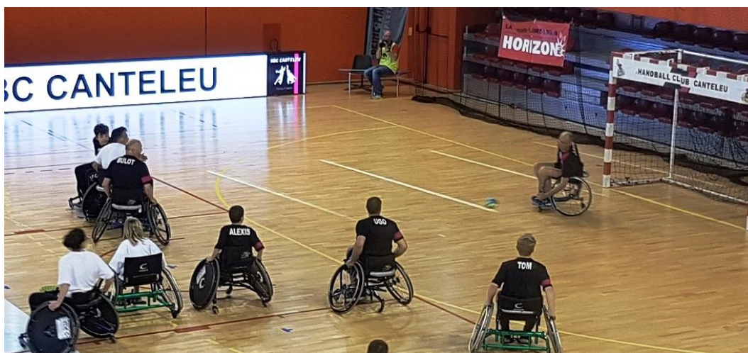
Le HBC CANTELEU au KINDARENA de ROUEN, lors des FINALES 76 JEUNES le Samedi 2 juin 2018.

Tous ces projets ne peuvent aboutir qu'avec votre concours.