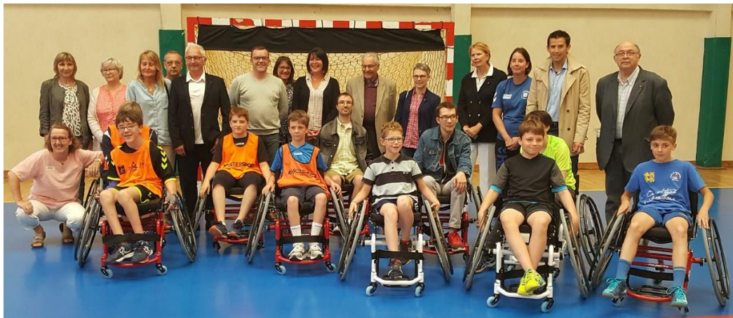
Le Comité 76 au lancement de la section Hand-fauteuil du DIEPPE UC, le Vendredi 1 er juin 2018

Dans le cadre de sa promotion, Le Comité a proposé une rencontre de démonstration de HAND-FAUTEUIL, lors des FINALES 76 JEUNES au KINDARENA le Samedi 2 Juin 2018, avec la participation des pratiquants du HBC CANTELEU.