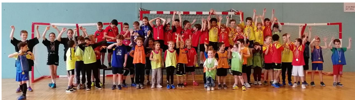
Illustration - Plateau Mini-Hand à BARENTIN-PAVILLY

MEGA-FETE DU MINI-HAND 2018 - SAMEDI 26 MAI 2018 YVETOT, Terrains à côté du Gymnase Vanier (Années de naissances des jeunes : 2009 à 2012)