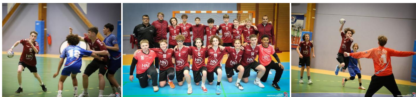
Sélection 76 Masculins 2012 - Trophée Michel BARBOT à BULLY LES MINES (4/5 Avril 2026 2026) 5 ème PLACE