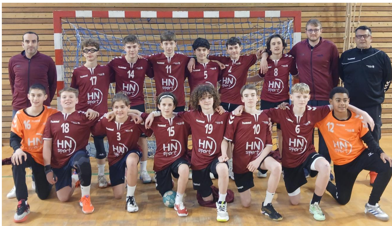
Sélection 76 Masculins 2012 - 2 ème Tour Territorial Inter-Comités à ST VALERY EN CAUX (24/25 Janvier 2026)

Stage de clôture de la génération : Journée Intergénérationnelle avec les 2013 = Partage-Convivialité