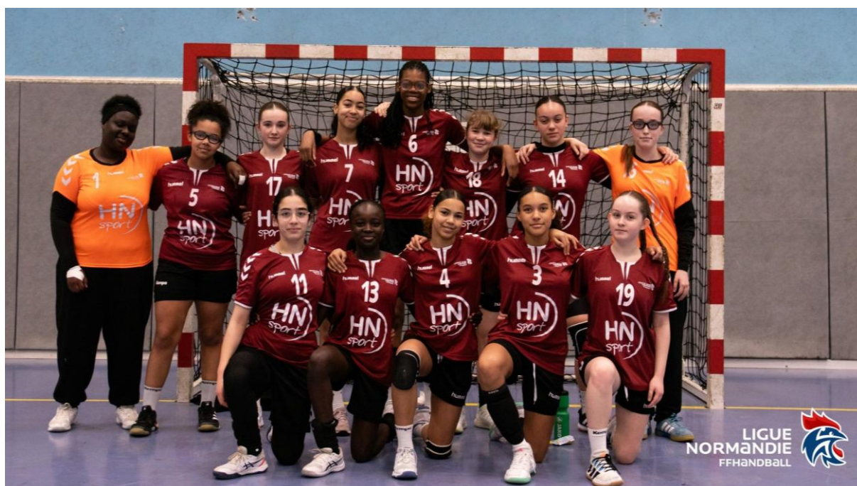
Sélection 76 au 2 nd Tour Territorial Inter-Comités - 25/26 Janvier 2025 à GRAND QUEVILLY

Président du Comité 76 / Référent élu de l'ETD 76