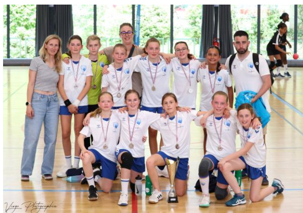
STADE VALERIQUEAIS HB VICE-CHAMPION EXCELLENCE - 13 ANS FEMINIENS