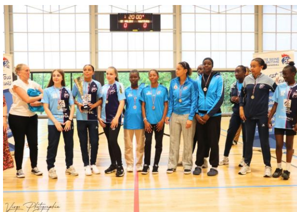
HAVRE AC 2 CHAMPION EXCELLENCE - 15 ANS FEMINIENS