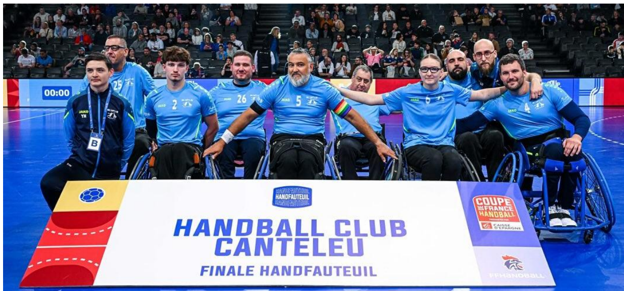
Le HBC CANTELEU en Finale de la COUPE DE FRANCE à l'ACCORD ARENA (PARIS-BERCY) le 18 Mai 2025