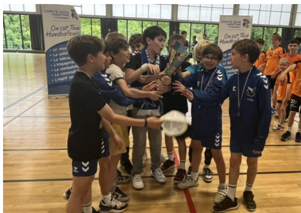
GCO BIHOREL VICE-CHAMPION EXCELLENCE - 11 ANS MASCULINS