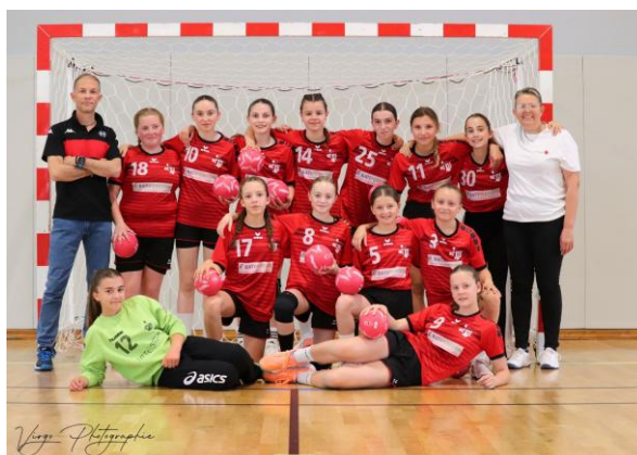
HBC EU CHAMPION EXCELLENCE - 13 ANS FEMINIENS