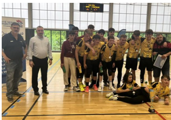
E MONTIVILLIERS/GONFREVILLE VICE-CHAMPION EXCELLENCE - 17 ANS MASCULINS