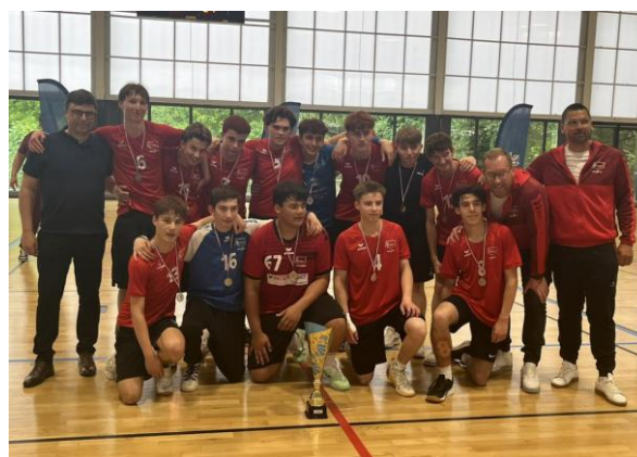
A BARENTIN/PAVILLY HB CHAMPION EXCELLENCE - 17 ANS MASCULINS