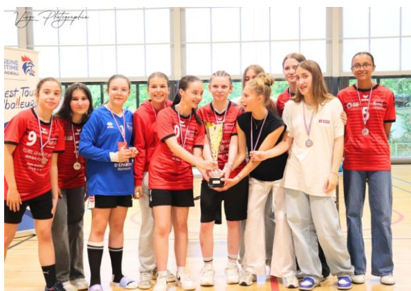
A BARENTIN/PAVILLY HB VICE-CHAMPION EXCELLENCE - 15 ANS FEMINIENS