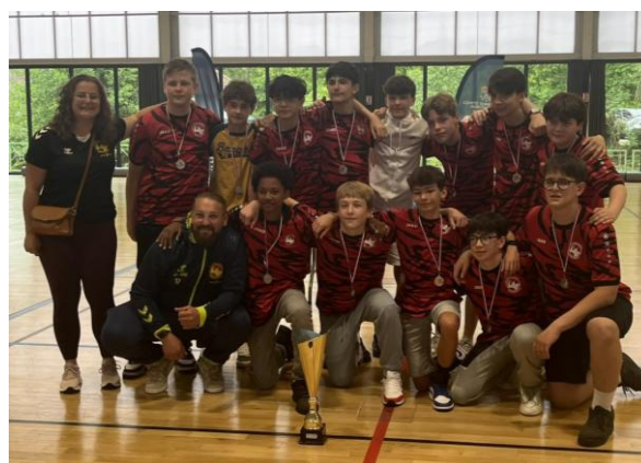
AL BUQUET-ELBEUF HB CHAMPION EXCELLENCE - 15 ANS MASCULINS