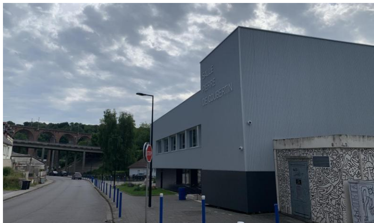
La Salle Pierre de Coubertin à BARENTIN - Site d'accueil des Finales Excellence 76 Jeunes 2024/2025