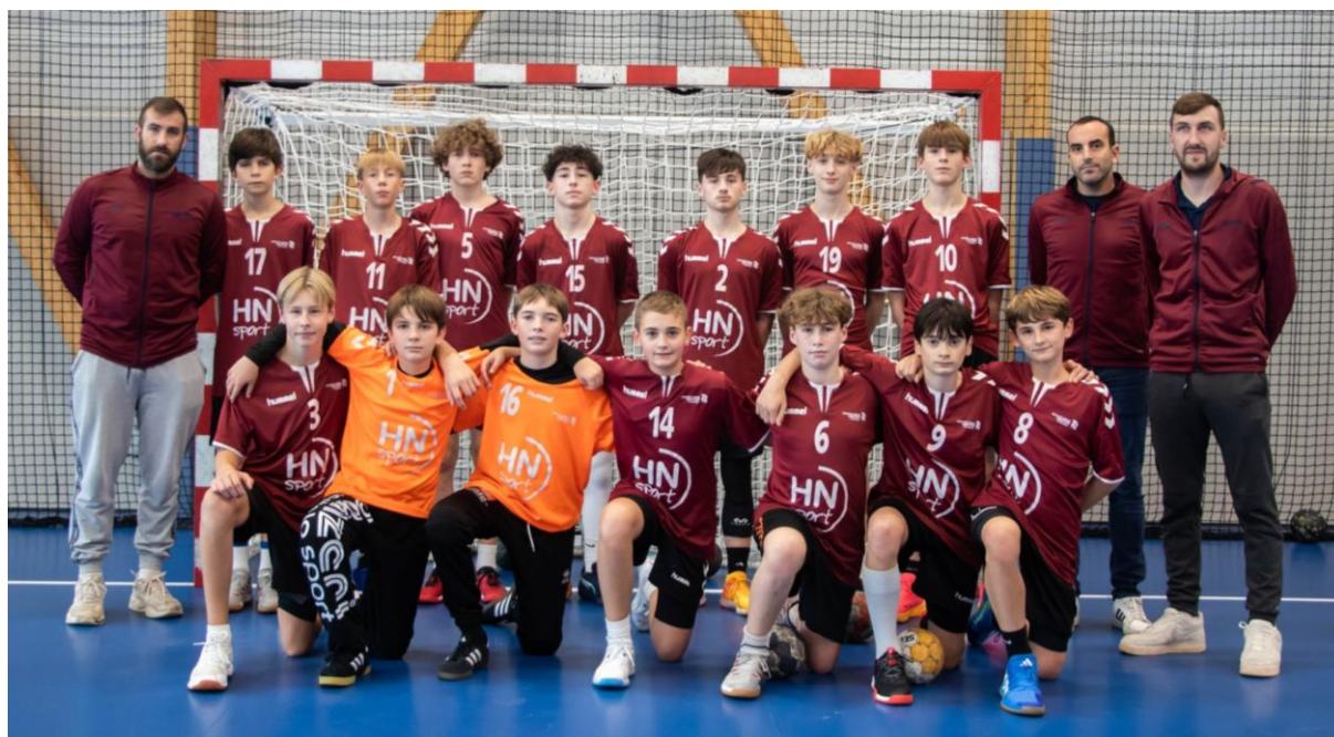
Sélection 76 au 1 er Tour Territorial Inter-Comités - 31 Octobre et 1 er Novembre 2025 à CAEN