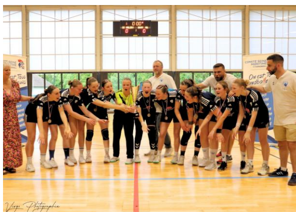
STADE VALERIQUEAIS HB CHAMPION EXCELLENCE - 17 ANS FEMINIENS