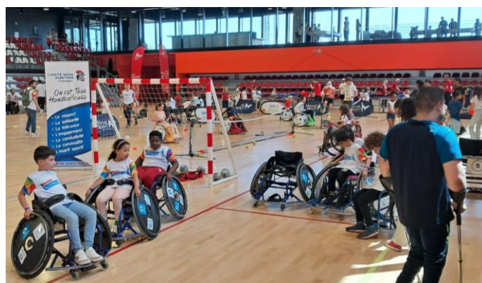
KINDARENA le 11 Juin - Journée avec la Fédération Française Handisport