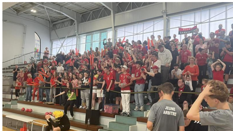
FINALES EXCELLENCE JEUNES + COUPES 76 SENIORS 31 Mai et 1 er JUIN 2024 à BARENTIN, Salle Pierre de Coubertin