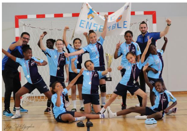
RC BOLBEC VICE-CHAMPION EXCELLENCE - 11 ANS FEMINIENS