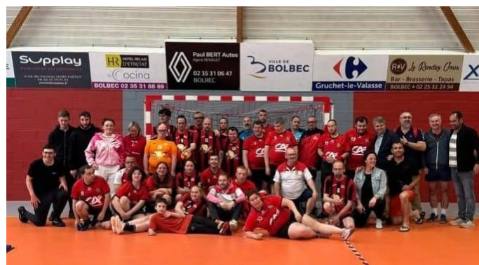
Rencontre HAND-ADAPTE entre BOLBEC et FECAMP