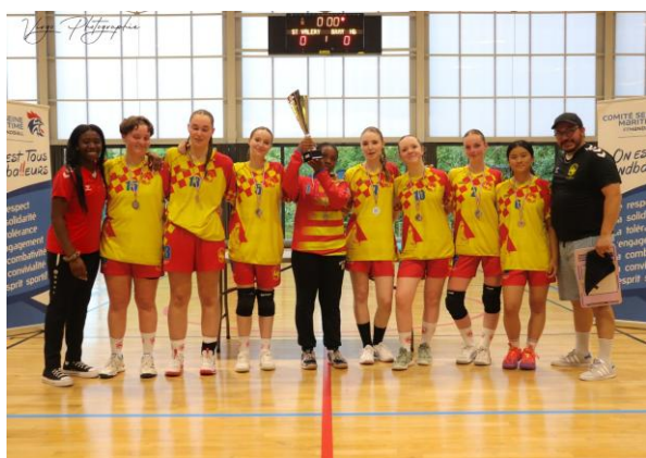
AL BUQUET/ELBEUF HB VICE-CHAMPION EXCELLENCE - 17 ANS FEMINIENS