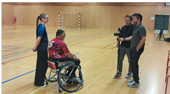
Tournage d'un reportage pour BEIN SPORT au club de CANTELEU