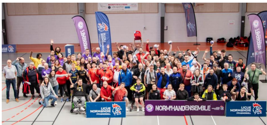
NORM'HANDENSEMBLE 2025 à MONTVILLIERS