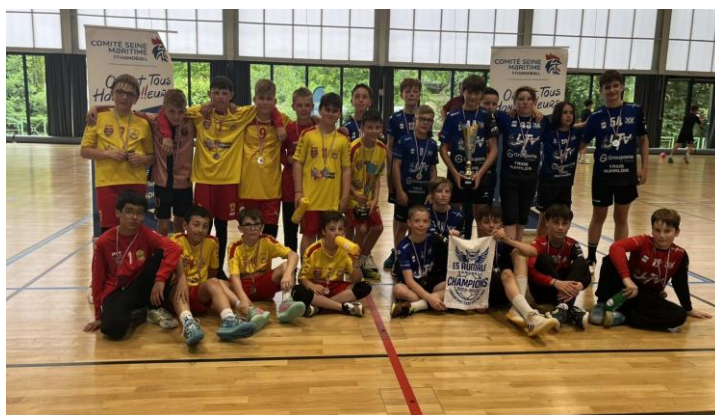
BRAY HB et ES AUMAËLE VICE-CHAMPION EXCELLENCE - 13 ANS MASCULINS et CHAMPION EXCELLENCE - 13 ANS MASCULINS