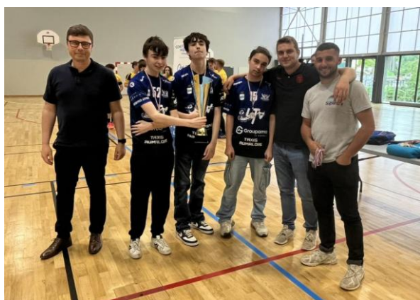
ES AUMAËLE VICE-CHAMPION EXCELLENCE - 15 ANS MASCULINS