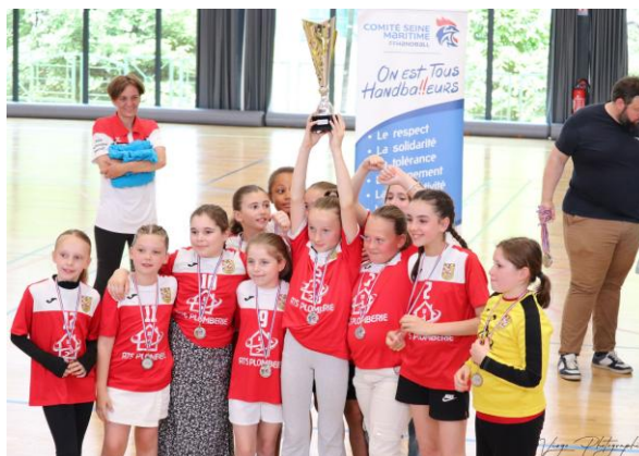
HAVRE AC CHAMPION EXCELLENCE - 11 ANS FEMINIENS