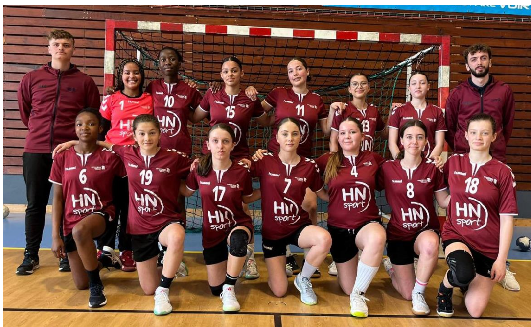
Sélection 76 au Trophée des Comités à BLOIS