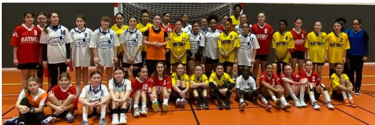
Inter-Secteurs 2011 Féminines à MONTIVILLIERS