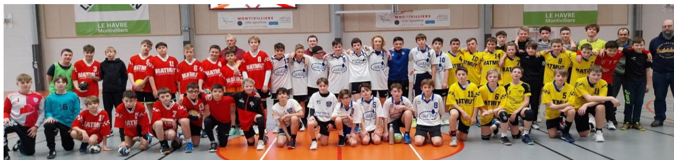
Inter-Secteurs 2011 Masculins à MONTIVILLIERS