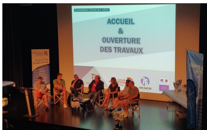
L'AG 2022 à MONTVILLE