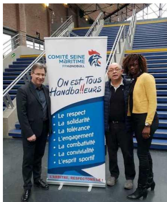
Remise du roll-up au HAVRE AC

Dans la continuité de la saison dernière, des outils de communication à destination des clubs ont été réalisés.